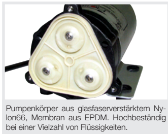
Pumpenkörper aus glasfaserverstärktem Nylon66, Membran aus EPDM. Hochbeständig bei einer Vielzahl von Flüssigkeiten.

Die angegebenen Fördermengen sind für Viskosität von 1 (=Wasser) gültig. Bei höherer Viskosität ist die Förderleistung geringer.