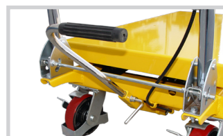
Rückenschonendes Arbeiten Anheben über integriertes Fußpedal

oder bei der Kommissionierung. Optimal als kleine Hebebühne oder auch als Motorhebebühne.