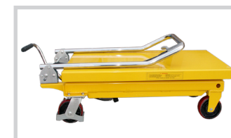
Griffbügel umlegbar (nur bei SHTM-A-0500)